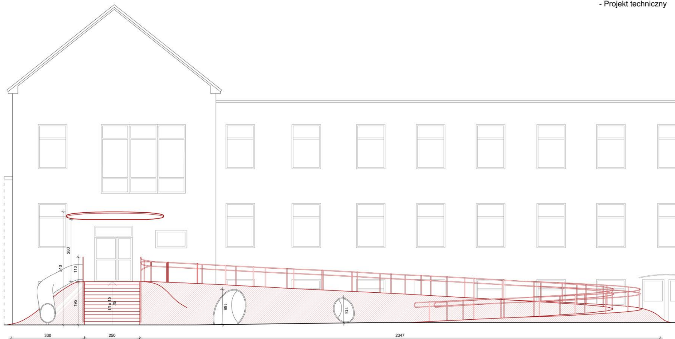
WIDOK ELEWACYJNY WEJŚCIA PROJEKTOWANEGO

Szczegółowe rozwiązanie konstrukcyjne zgodnie z CZĘŚCIĄ III opracowania - Projekt techniczny